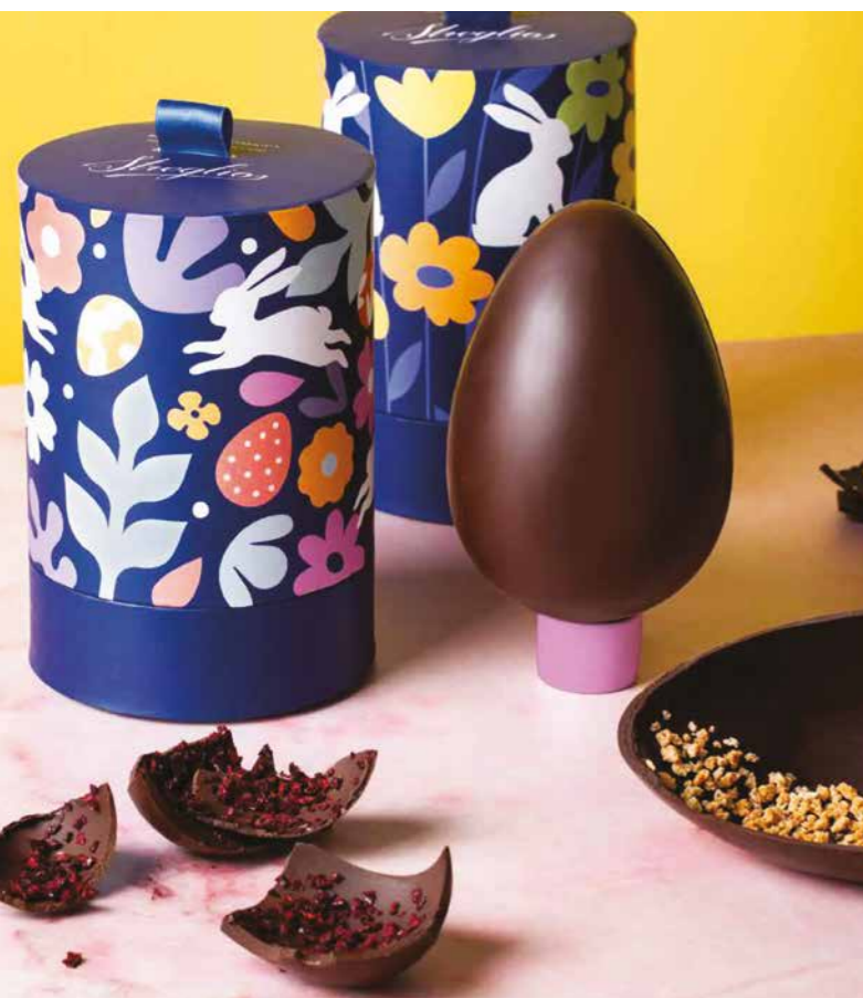
STOV18 - UOVO FONDENTE AL BUNET 150G / € 14,00 + IVA