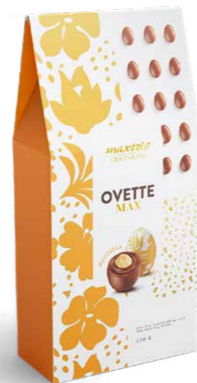
MXP004 - OVETTE MAX NOCCIOLA ASTUCCIO 220G / € 5,60 + IVA