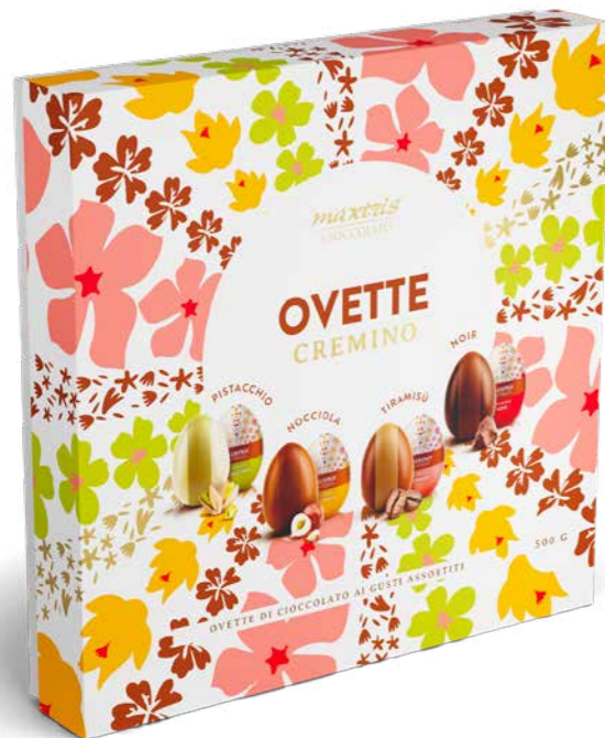
MXP003 - OVETTE BOX CREMINO ASSORTITE 500G / € 14,90 + IVA

Gli ovetti Maxtris uniscono cioccolato al latte o fondente e ripieni morbidi ai gusti pistacchio, nocciola, tiramisù, fondente e bianco, spesso avvolti da una sottile copertura confettata colorata che li rende scenografici in ogni occasione.