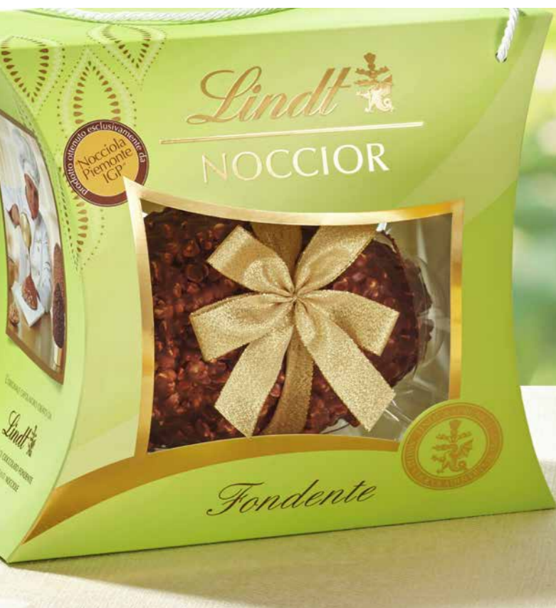
LI853357 - NOCCIOR FONDENTE 610G / € 48,00 + IVA