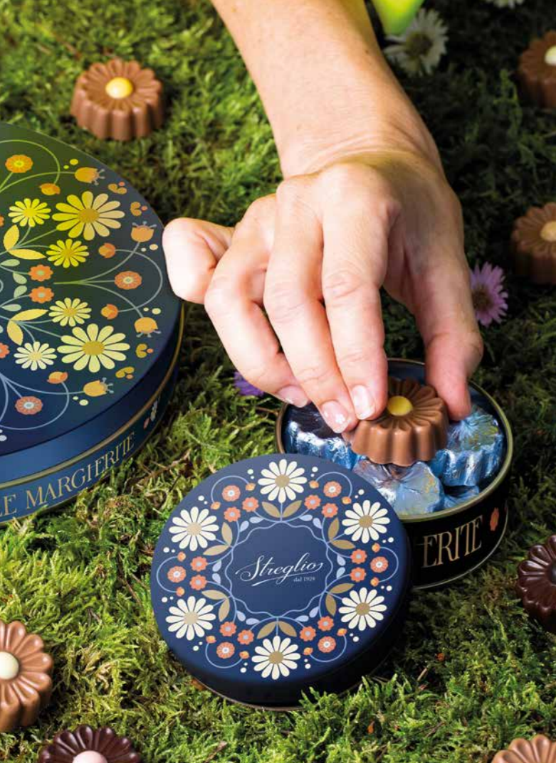
STLAT06 - LATTIA CIOCCOLATINI MARGHERITE 55G / € 4,50 + IVA