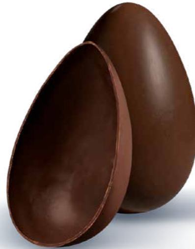
CA866027 - UOVO FONDENTE 150G / € 18,20 + IVA

Le uova di cioccolato al latte o fondente valorizzano il giandua morbido e vellutato per un'esperienza ricca e avvolgente.