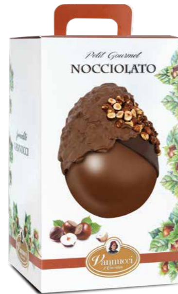
VNP007 - UOVO PETIT GOURMET MANDORLATO 350G / € 35,00 + IVA VNP008 - UOVO PETIT GOURMET NOCCIOLATO 350G / € 35,00 + IVA