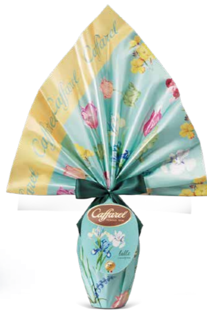
CA866026 - UOVO AL LATTE 150G / € 18,20 + IVA