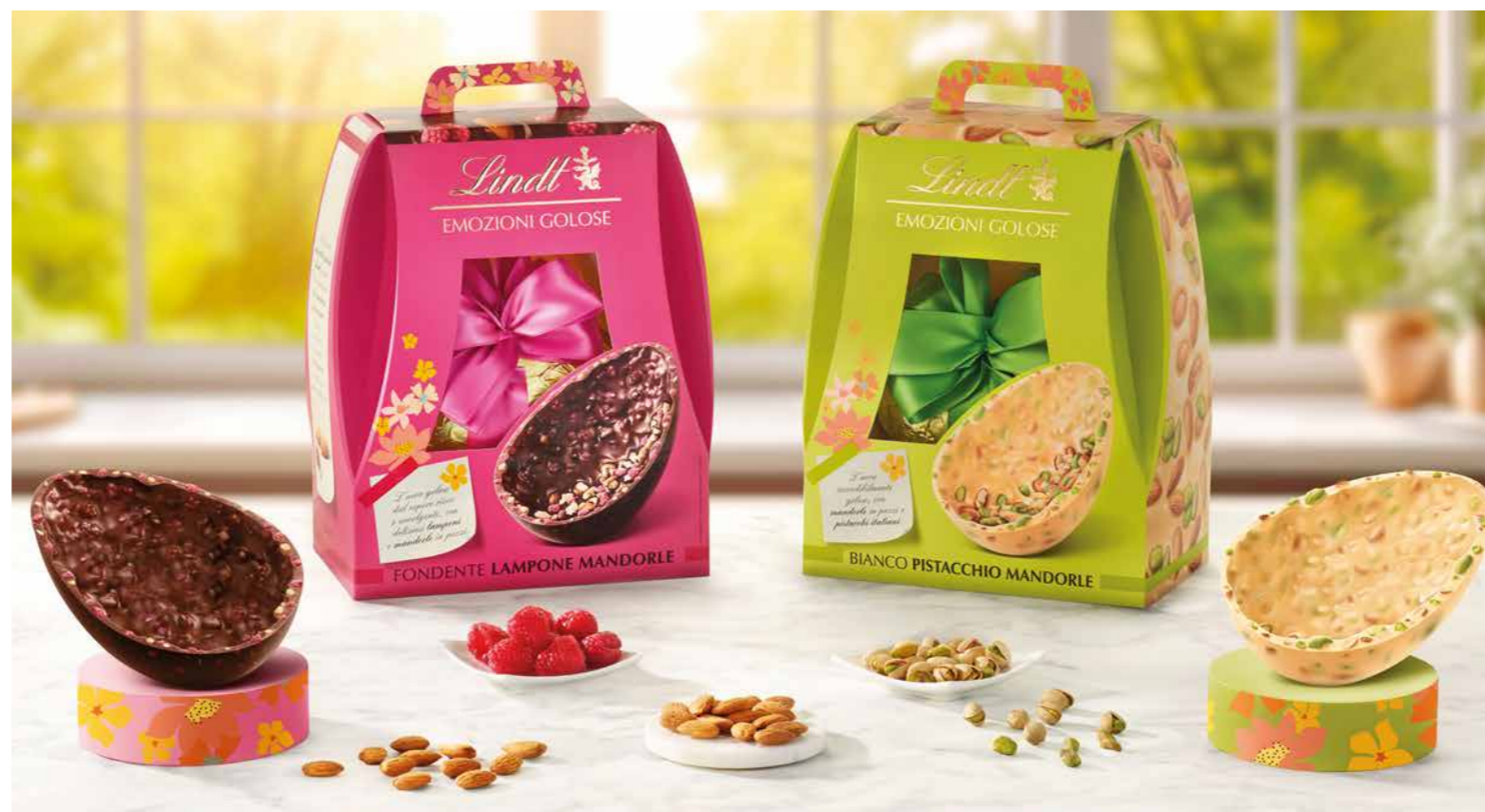
LI850959 - UOVO FONDENTE LAMPONE 360G / € 36,50 + IVA