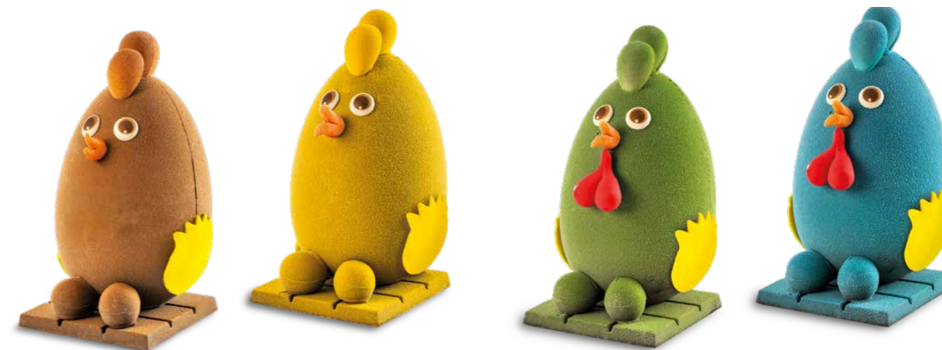
MMP007 - UOVO FONDENTE MISS GALLINA 330G / € 25,50 + IVA