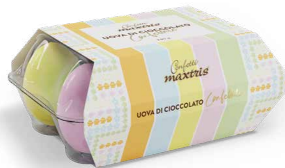
MXP002 - UOVA DI GALLINA CONFETTATE PZ6 / € 12,20 + IVA