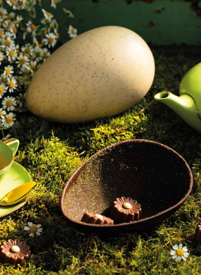
STOV07 - UOVO L'ERBAVOLGIO BIANCO CAFFÈ 300G / € 19,00 + IVA STOV08 - UOVO L'ERBAVOLGIO FONDENTE MENTA 300G / € 19,00 + IVA