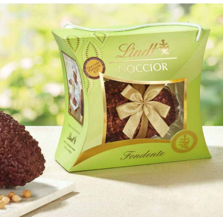
LI853356 - NOCCIOR FONDENTE 390G / € 31,00 + IVA