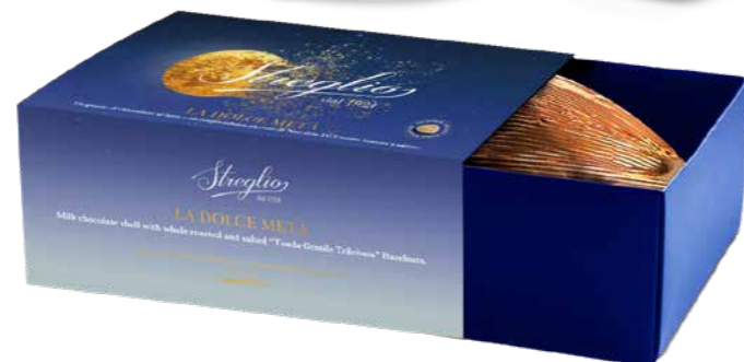
STOV11.2 - UOVO LA DOLCE METÀ FONDENTE 350G / € 20,50 + IVA