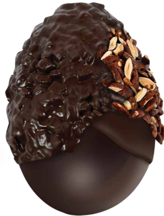
VNP005 - UOVO TRASPARENZE MANDORLATO 650G / € 58,50 + IVA VNP006 - UOVO TRASPARENZE NOCCIOLATO 650G / € 58,50 + IVA

Il dono d'autore Ogni creazione Vannucci è pensata per chi ama un cioccolato intenso, elegante e profondamente legato alla tradizione di Perugia