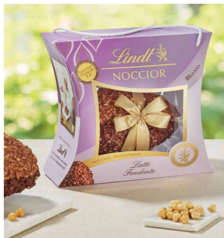
LI853097 - NOCCIOR BIGUSTO 610G / € 53,50 + IVA

Pasqua Lindt Protagonista è la linea Noccior, uova di cioccolato al latte o fondente dal gu- scio spesso e croccante, ricoperto da un ricco strato di Nocciola Piemonte IGP, per un'esperienza intensa e avvolgente. La collezione si completa con le uova Emozioni Golose, pensate per chi ama consistenze e abbinamenti gourmand.