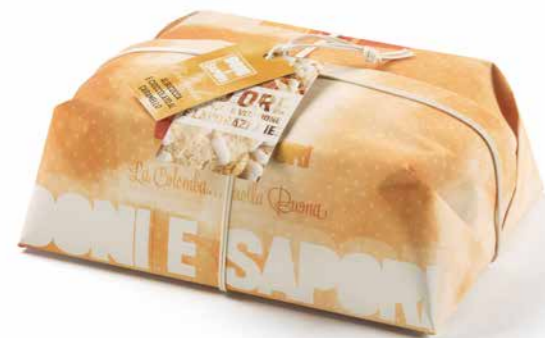
CL79 - COLOMBA ALBICOCCA LIMONE 750G / € 13,60 + IVA

Impasto delicato e soffice, ottenuto con puro lievito madre, mediante una lavorazione lenta e naturale di oltre 40 giorni. Primaveraile... ispirata da Profumi Mediterraneo, con Canditi di Albicocca e Limone. Classata alla nocciola, arricchita con mandorle intere e granella di zucchero.