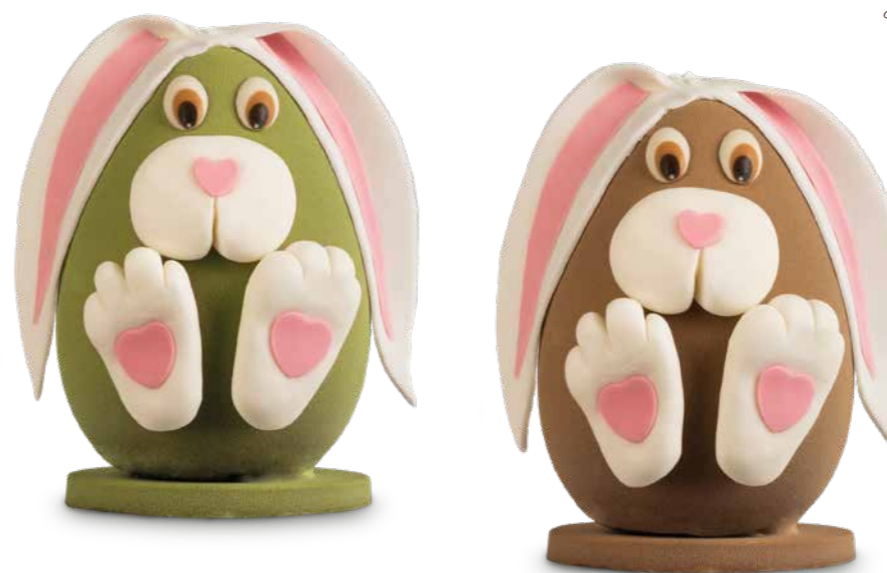
MMP009 - UOVO AL LATTE MISTER RABBIT 330G / € 25,50 + IVA

buffi animalotti, frutto di tanta fantasia, rigorosamente decorati a mano, nascondono divertenti e utili sorprese!