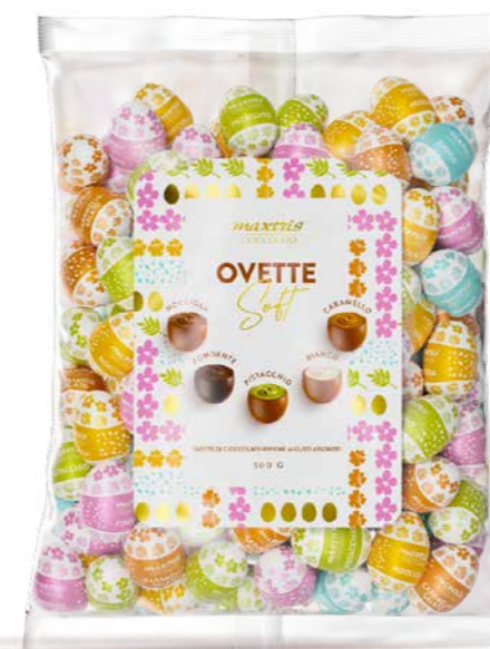
MXP006 - OVETTE SOFT MIX BUSTA 500G / € 12,00 + IVA