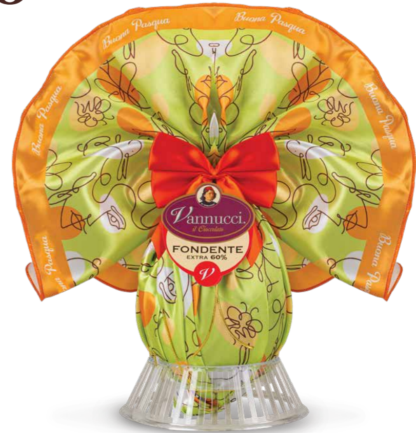
VNP001 - UOVO CLASSICO FONDATE 300G / € 28,30 + IVA fazzoletto in raso