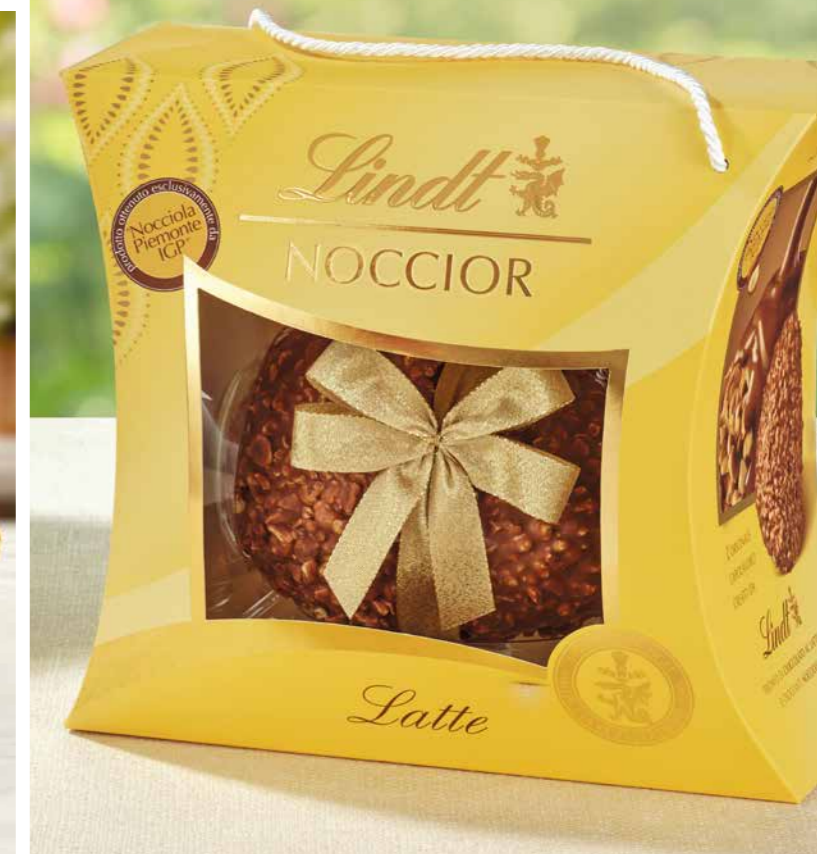
LI853352 - NOCCIOR LATTE 610G / € 48,00 + IVA