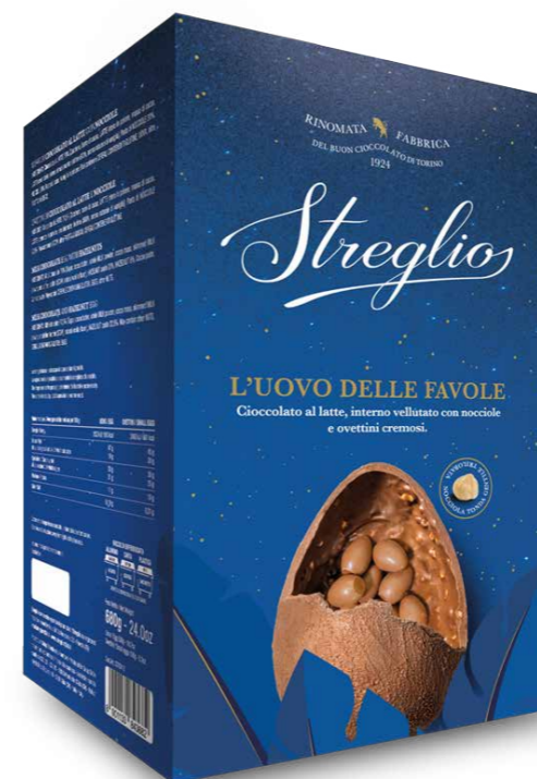
STOV14.1 - L'UOVO DELLE FAVOLE AL LATTE / € 36,00 + IVA

Cioccolateria Artigianale Piemontese dal 1924