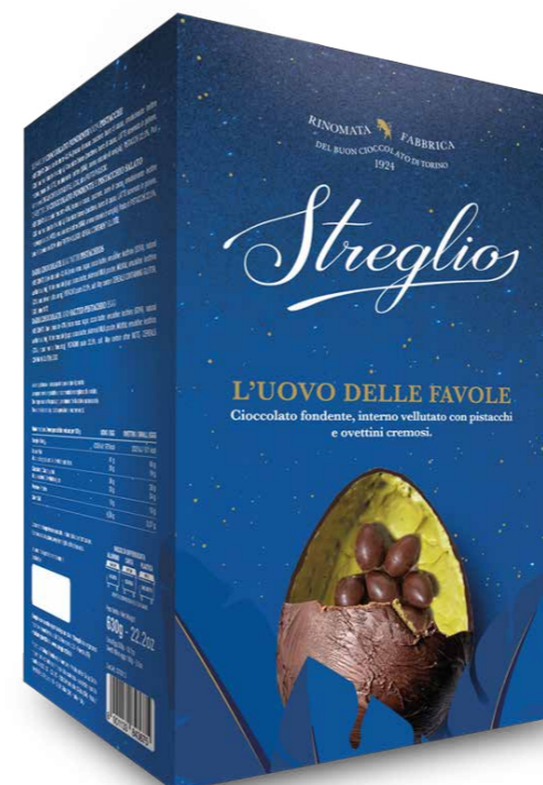
STOV14.2 - L'UOVO DELLE FAVOLE AL PISTACCHIO / € 36,00 + IVA

Un dono di tradizione Per chi cerca la dolcezza autentica, Streglio offre creazioni che sussurrano la storia del cioccolato piemontese. Eleganza, equilibrio, emozione: il piacere di un gesto unico.