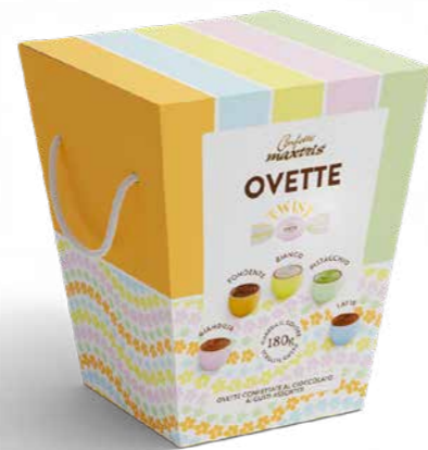
MXP001 - OVETTO CONFETTATO TRAPEZIO 180G / € 5,00 + IVA

Confezioni regalo pensate per la Pasqua e perfette l'ufficio: mix di ovetti assortiti incartati singolarmente.