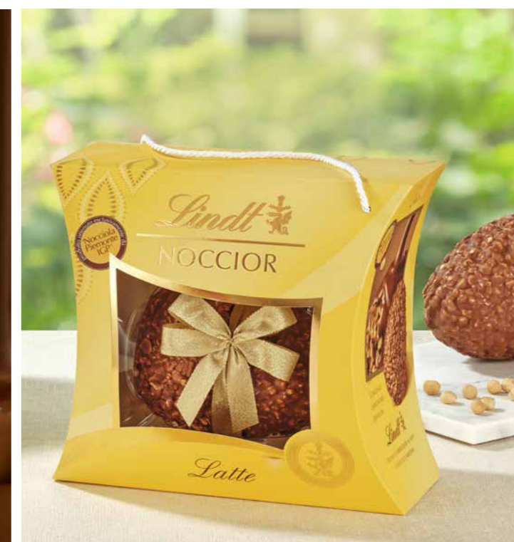
LI853350 - NOCCIOR LATTE 390G / € 31,00 + IVA

Il dono raffinato Ogni uovo Lindt è studiato per offrire un momento di piacere autentico: un regalo che unisce eleganza e cura del dettaglio.