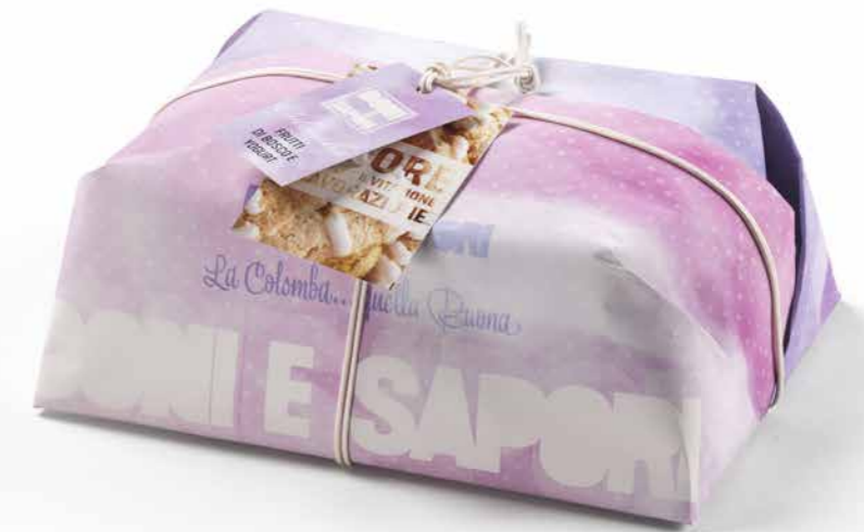
CL77 - COLOMBA FRUTTI DI BOSCOE 750G / € 13,60 + IVA

Impasto delicato e soffice, ottenuto con puro lievito madre, mediante una lavorazione lenta e naturale di oltre 40 giorni. Un piacevole contrasto di sapori, la dolcezza dello yogurt e le note acidule dei frutti di bosco, fragole, more di rovo, ribes rossi, ribes neri e mirtilli semicanditi. Classata alla nocciola, arricchita con mandorle intere e granella