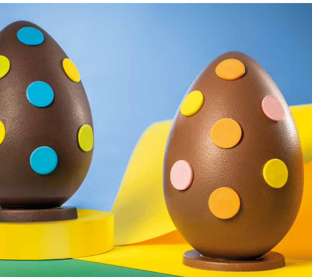
MMP005 - UOVO 400G FONDENTE POIS / € 25,50 + IVA