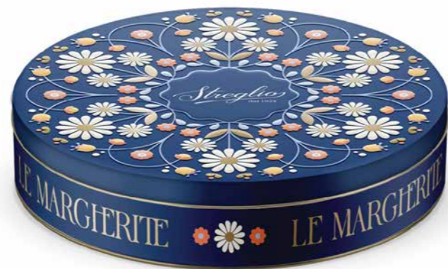
STLAT05 - LATTIA CIOCCOLATINI MARGHERITE 210G / € 16,00 + IVA